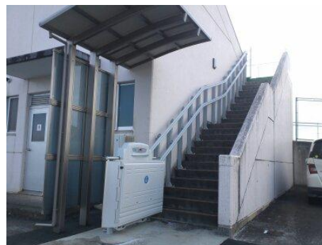
車椅子用段差解消機(昇降機)