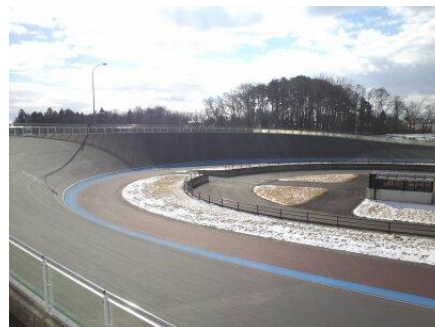
第3コーナーから第4コーナー