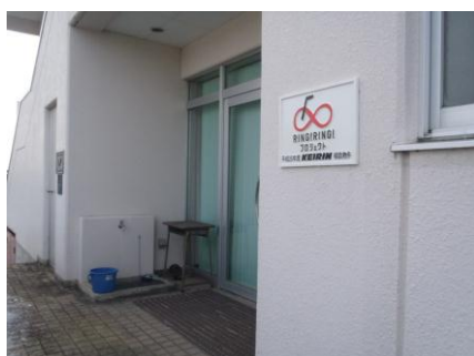
正面玄関の標識表示