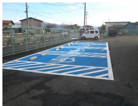
障がい者用駐車場（4台分）