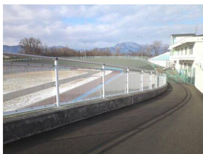
外周アクリルボード