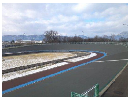
ホームストレッチから第2コーナー